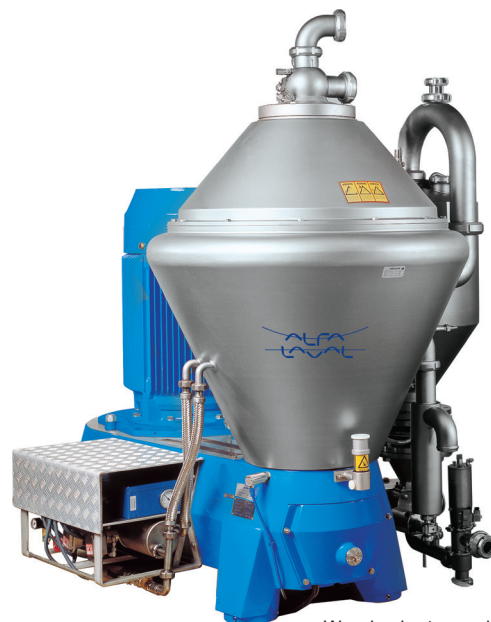
Wysokoobrotowa wirówka z napędem pasowym